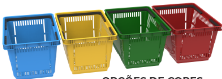
OPÇÕES DE CORES (SOB CONSULTA)